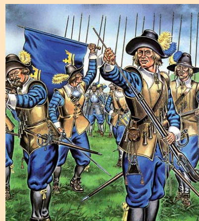
Piechota szwedzka-połowa XVIIw