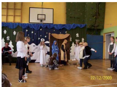
Jasełka w gimnazjum