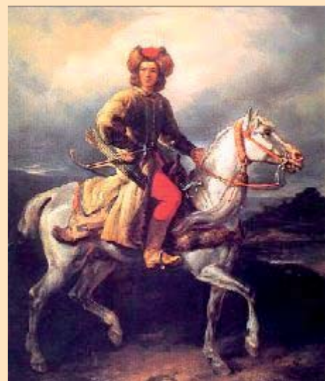
Lisowczyk połowa XVIIw