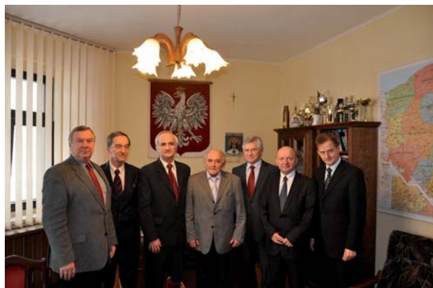
Wspólne zdjęcie uczestników konwentu

Zmiany dotyczące likwidacji gminnych i powiatowych Funduszy Ochrony Środowiska będą skutkowały zmianami dofinansowania działań proekologicznych np. wymiana kotłów CO, likwidacja niskiej emisji, unieszkodliwianie