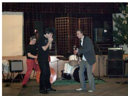
Blues na deskach GDK