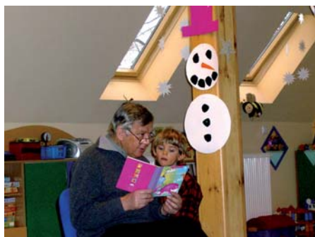
W trakcie czytania zimowego dnia