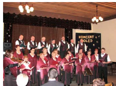
Na zdjęciu chór Harmonia