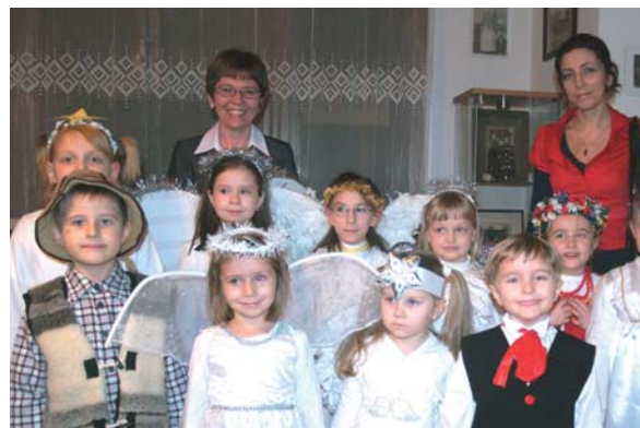
Kobyrzoki z opiekunkami

z przedszkolnego zespołu „Kobyrzoki” mają możliwość dalszego rozwijania swoich zainteresowań i zdolności muzyczne – wokalnych w szkolnym zespole regionalnym „Kobiórko Czeladka”.