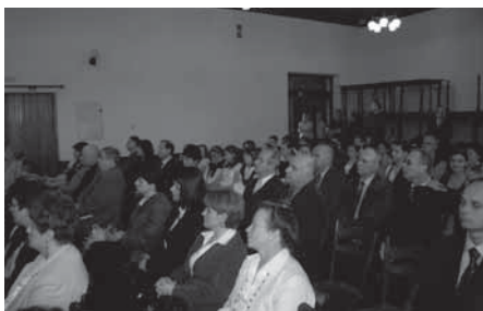
Na sali spotkali się bohaterowie wydarzeń sprzed dwudziestu lat, radni, dyrektorzy placówek oświatowych i młodzież