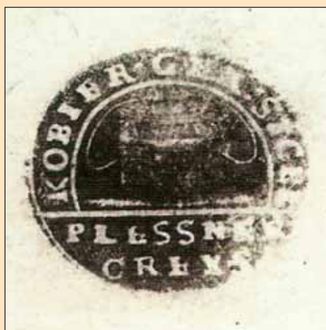
Pieczęć z 1840 roku