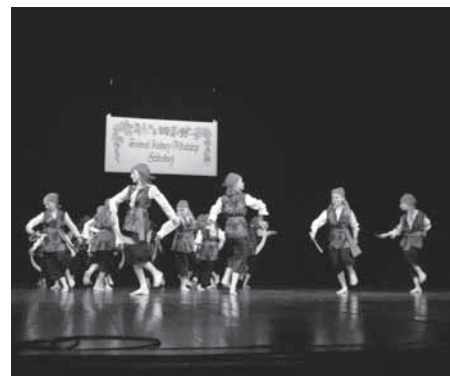
Smyki podczas XX Jubileuszowego Rejonowego Festiwalu Młodzieży Szkolnej