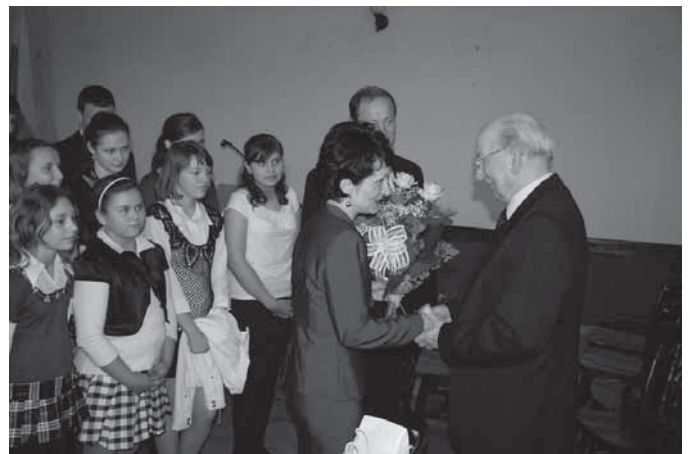
Podziękowania ze strony dyrektorów placówek oświatowych i dzieci