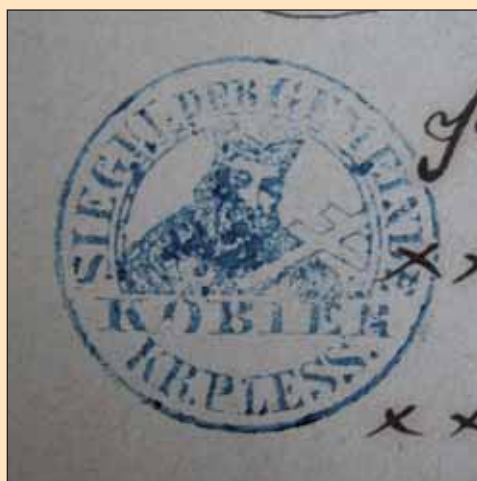
Pieczęć z 1867 roku