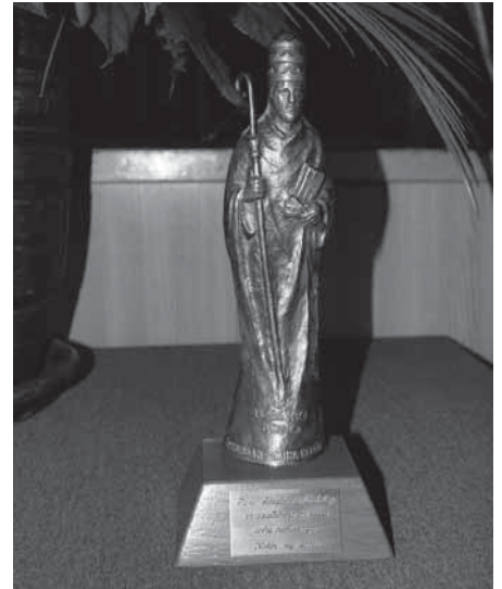
Statuetka świętego Urbana