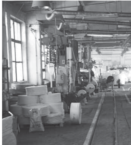
Wnętrze zakładu