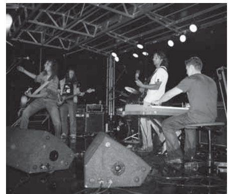
Na scenie zespół KFM