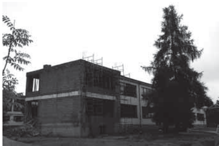
Prace budowlane przy rozbudowie szkoły