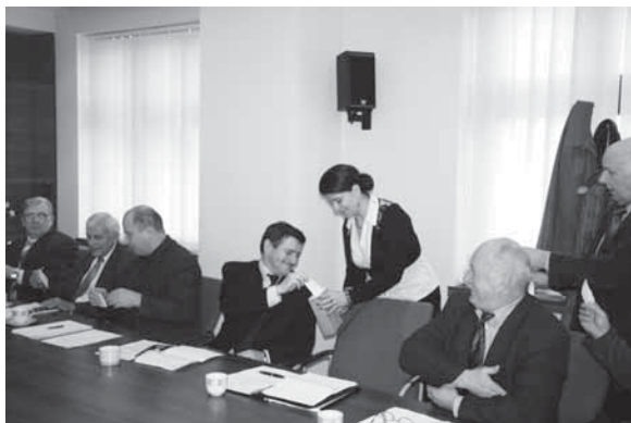
Wybór ławników odbywał się w głosowaniu tajnym