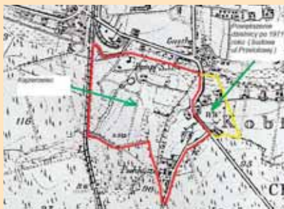
Kajzerowiec, rok 1881