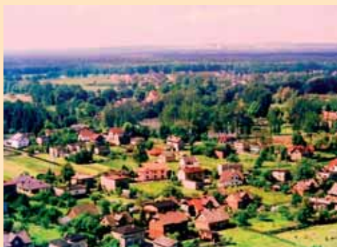
Lot helikoptera 03. 06.2001