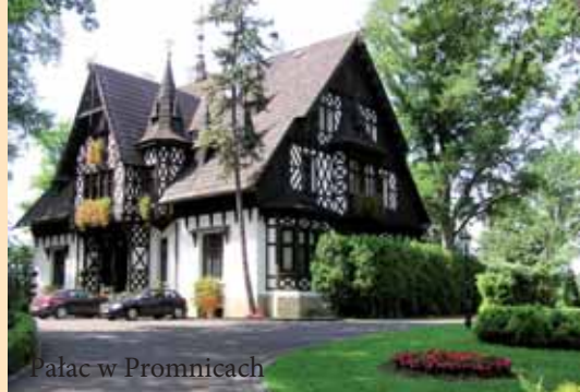
Pałac w Promnicach