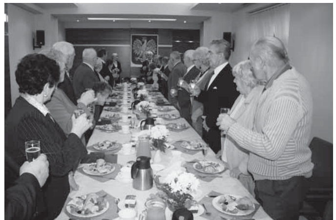
Lampką szampana uczczono długoletnich małżonków.