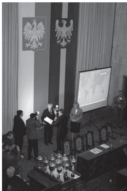
Wręczenie nagrody odbyło się w Sali Sejmu Śląskiego