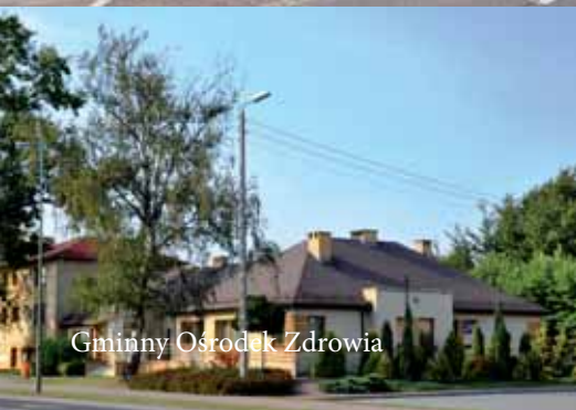
Gminny Ośrodek Zdrowia