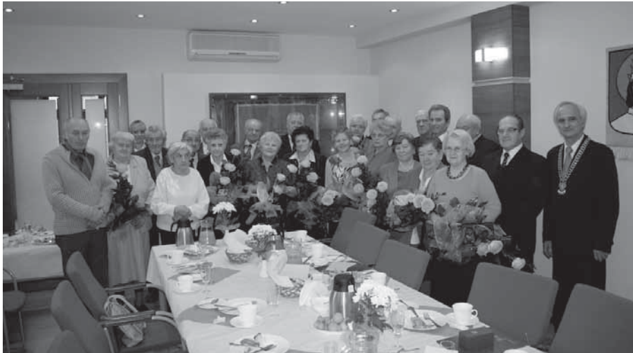
Wspólne zdjęcie wszystkich par wraz z wójtem gminy.