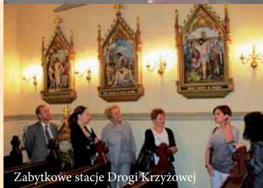
Zabytkowe stacje Drogi Krzyżowej