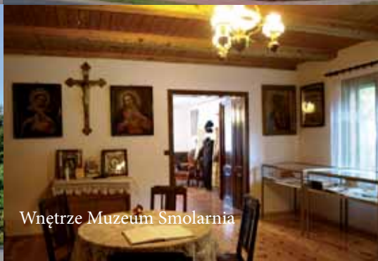
Wnętrze Muzeum Smolarnia