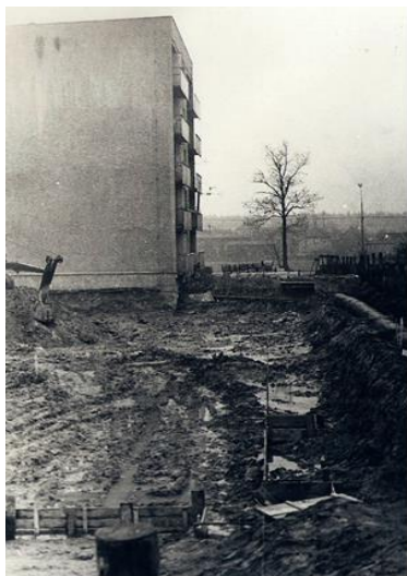
Fot. Budowa bloku 30-38 - wiosna 1970

Nowy etap w zarządzaniu budynkami wielorodzinnymi przy ul. Centralnej w Kobiórze, jest okazją do przypomnienia historii ich powstania. Budynek wybudowany w technologii wieloblokowej o numerze 30 mieszczący 15 mieszkań na 5 kondygnacjach nadziemnych, został oddany do użytku w 1969 roku. Czteroklatkowy (40 mieszkań) budynek z wielkich płyt betonowych przy ul. Centralnej 32-38 oddano do użytku w 1972 roku.