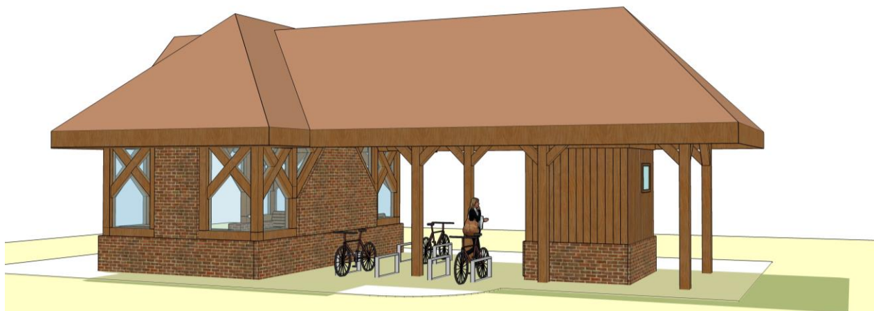
Rys. Wizualizacja planowanej wiaty przystankowej (widok od strony ronda)