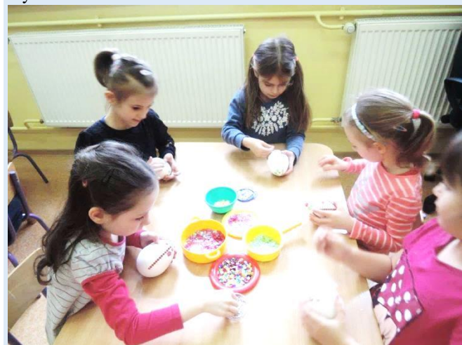
Dyrektor Gminnego Przedszkola w Kobiórze wraz z dziećmi, nauczycielami i pracownikami JD

Frekwencja, jak co roku dopisała. Zapraszanie Babć i Dziadków na uroczystość z okazji ich święta jest tradycją, na stałe wpisaną w repertuar imprez przedszkolnych. Zbliżają się kolejne Święta i tym razem pamiętamy o najstarszych mieszkańcach naszej Gminy. Starszaki z grupy Stokrotki na zajęciach przygotowały koszyczki wielkanocne, a Panie kucharki upiekły babeczki, które zostaną wręczone podopiecznym Dniennego Domu Opieki w Kobiórze. Korzystając z okazji składamy życzenia wszystkim mieszkańcom Gminy Kobiór. Życzymy zdrowych, pogodnych Świąt Wielkanocnych. Niech te szczególne dni będą pełne wiary, nadziei, łaski, miłości i optymizmu. Oby świąteczny nastrój towarzyszył świątecznym spotkaniom w gronie najbliższych.