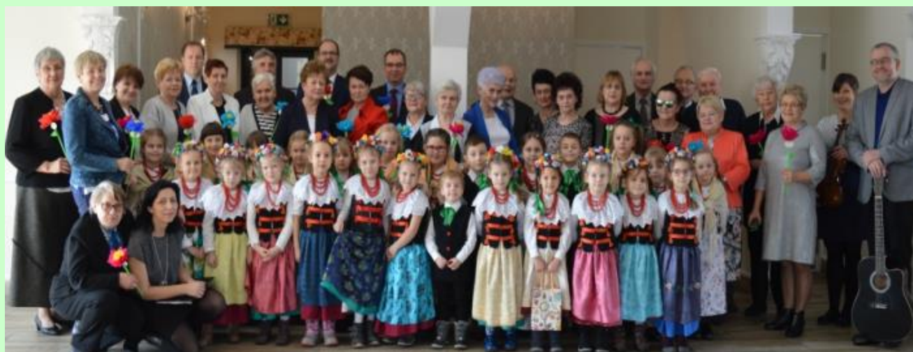
Fot. Koło Nauczycieli Emerytów wraz z zaproszonymi gośćmi oraz Kobyryzokami