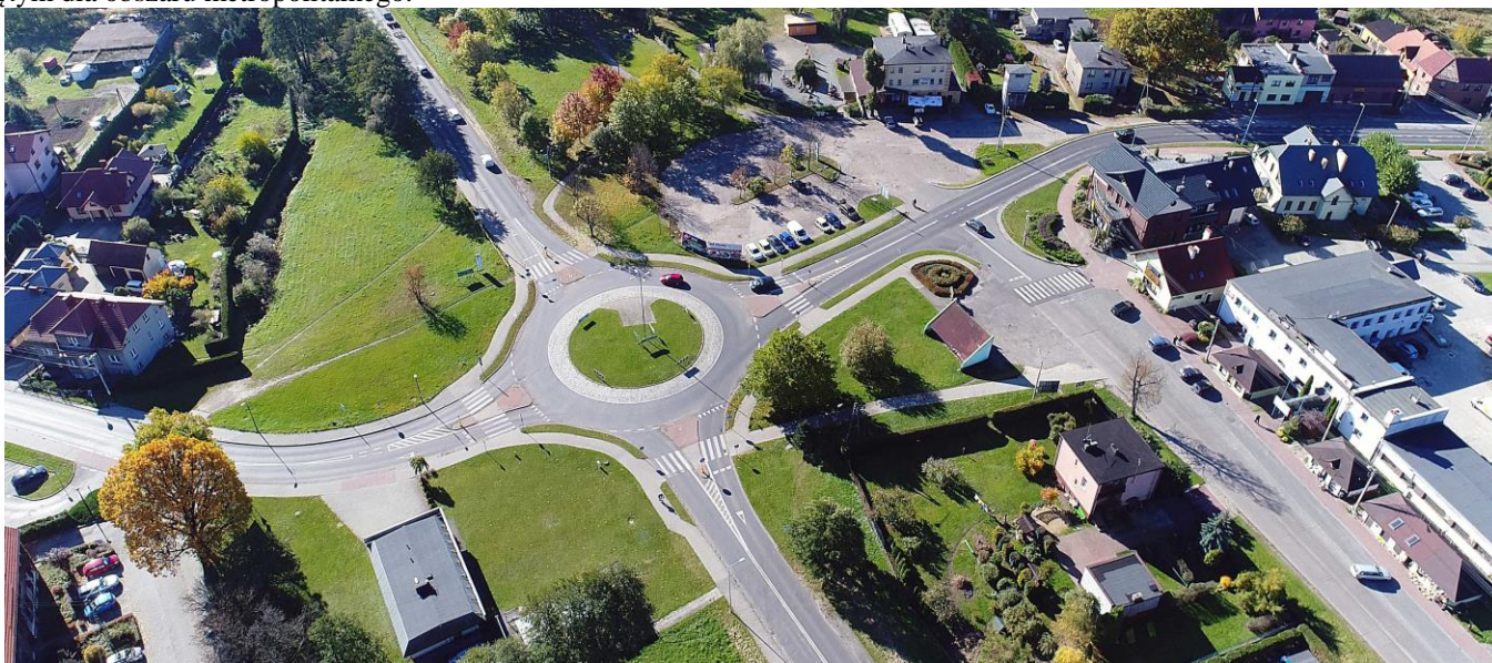
Fot. Obszar podstawowych zadań projektowych, związanych z utworzeniem Metropolitalnego Centrum Przesiadkowego

5. Planuje się w terenie objętym projektem wymianę istniejącego oświetlenia oraz budowę dodatkowych punktów z uwzględnieniem energooszczędnej technologii LED. Napowietrzna sieć energetyczna będzie zlikwidowana a cały obszar będzie monitorowany. Będą wydzielone miejsca do cumowania rowerów, elementy architektury miejskiej i system informacji zgodny z przyjętym dla obszaru metropolitalnego.