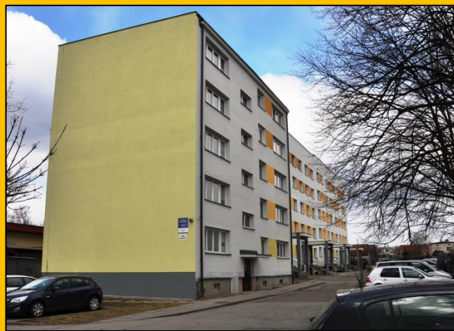
Fot. Widok od południa - marzec 2018

Tegoroczna „przewlekła” zima odchodzi bezpowrotnie, a pierwsze słoneczne promienie nadchodzącej wiosny, wyeksponowały świeżo odnowioną elewację budynków, które jeszcze niedawno „przygnębiały” swoim niedopasowaniem do tradycyjnej niskiej zabudowy Kobióra. Potwierdziła się - być może pseudonaukowa teoria, że dobrze dobrany kolor jest lekarstwem na wszystkie dolegliwości. Co tu dużo mówić - to miejsce naszej gminy, zmieniło diametralnie na korzyść swoje oblicze.