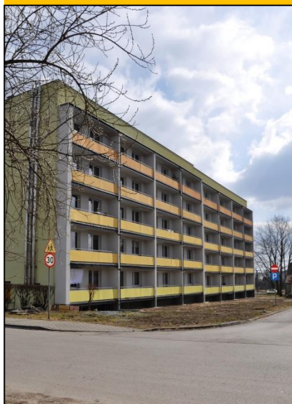
Fot. Widok od zachodu - marzec 2018

Aby wyjaśnić czytelnikom genezę tej „metamorfozy” przypomnieć należy, że w 2014 roku Rada Gminy w Kobiórze, po przeprowadzeniu szeregu konsultacji, podjęła uchwałę o sprzedaży mieszkań dotychczasowym najemcom z zastosowaniem bonifikaty w wysokości uzależnionej od okresu użytkowania lokali.