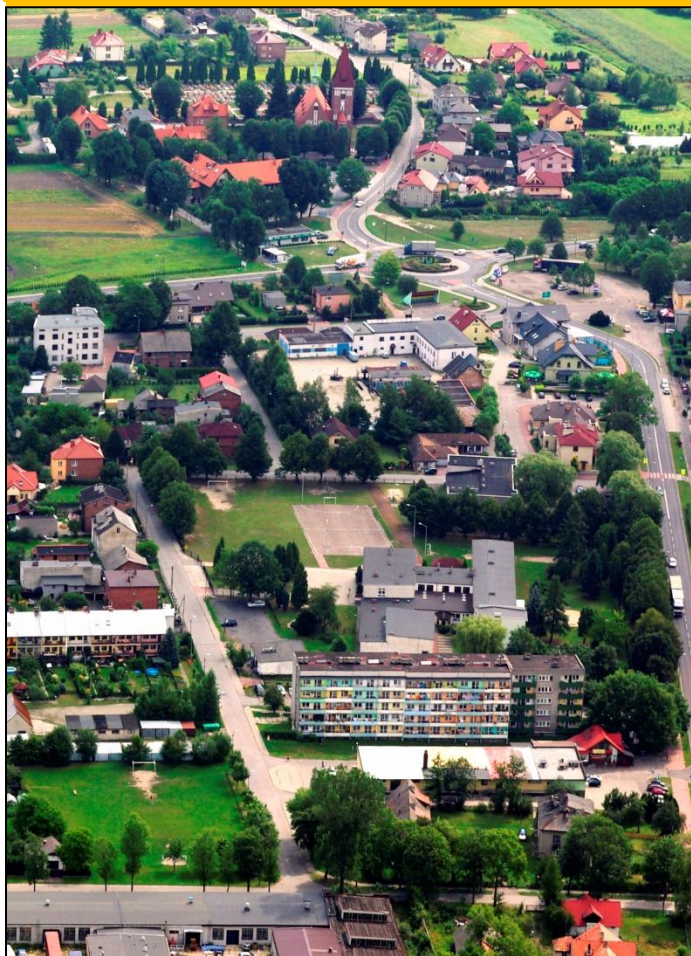
Fot. Ulica Tuwima z lotu ptaka - rok 2012; po inwestycjach z lat 2017 - 2018 , fotografia ma już wartość „historyczną”

Już tak dojrzały wiek osiągnęły „bloki” mieszkalne wpisane w rejestrze numeracji pod ulicą Centralną 30-38, ale obsługiwane obecnie jedynym pojazdem od strony ulicy Tuwima. Ta zabudowa ma zatem pełne prawo znaleźć swoje miejsce na tych stronach.