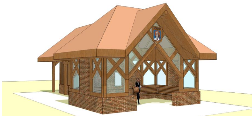
Rys. Wizualizacja planowanej wiaty przystankowej (widok od strony ul. Kobióŕskiej)

1.Obszar terenu obejmujący skrzyżowanie ul. Centralnej, starej drogi Kobióŕskiej i parkingów przed restauracją „Pod Sikorką” będzie stanowił po przebudowie tzw. Metropolitalny Węzeł Przesiadkowy; stara wiat przystankowa będzie wyburzona, a w jej miejscu pojawi się nowy obiekt wraz z zadaszeniem na rowery oraz sanitariat ogólnodostępny wyposażony w czujniki i sygnalizację niewłaściwego funkcjonowania.