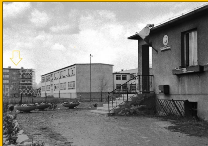
Fot. Rok 1969- w tyle blok nr 30 w dniu 1 Maja