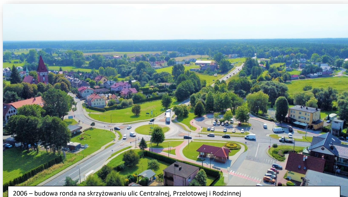
2006 – budowa ronda na skrzyżowaniu ulic Centralnej, Przelotowej i Rodzinnej