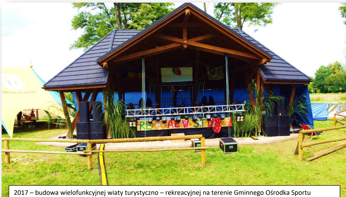
2017 – budowa wielofunkcyjnej wiaty turystyczno – rekreacyjnej na terenie Gminnego Ośrodka Sportu