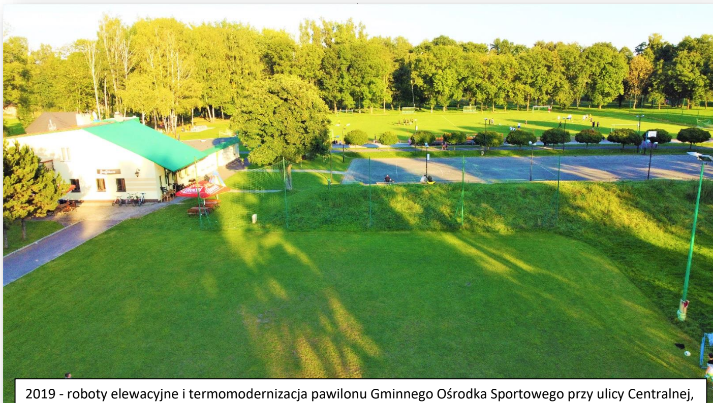
2019 - roboty elewacyjne i termomodernizacja pawilonu Gminnego Ośrodka Sportowego przy ulicy Centralnej, budowa oświetlenia boiska treningowego, budowa dróg wewnętrznych, parkingów, studni głębinowej, zakup trybuny