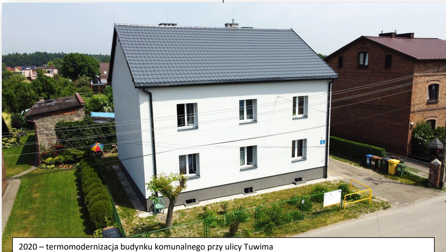
2020 – termomodernizacja budynku komunalnego przy ulicy Tuwima