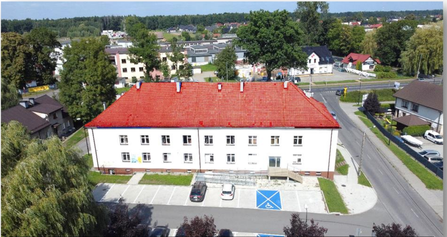
2019 – termomodernizacja budynku przy ulicy Centralnej 57 wraz z parkingami i podjazdem dla osób niepełnosprawnych