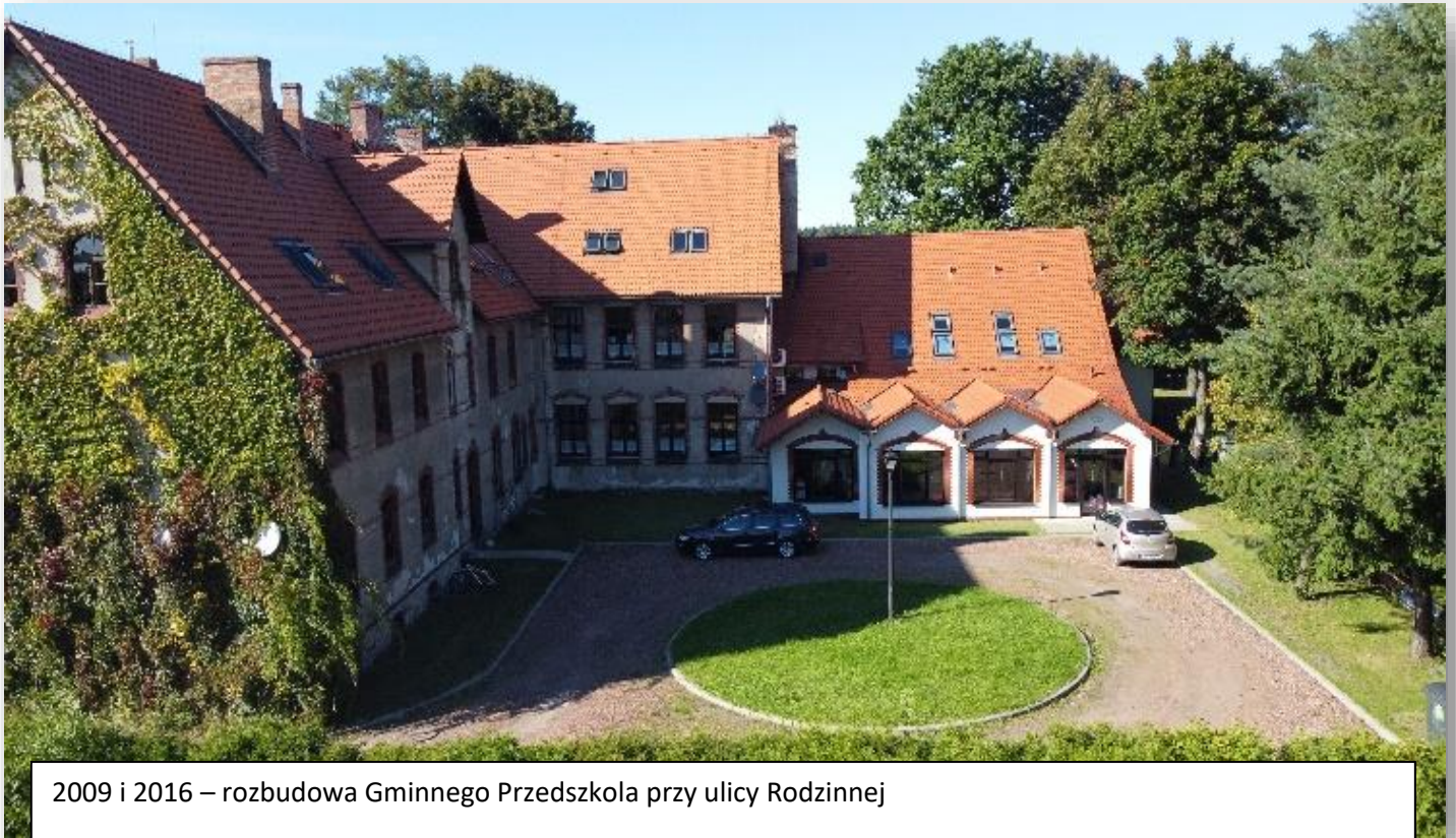
2009 i 2016 – rozbudowa Gminnego Przedszkola przy ulicy Rodzinnej