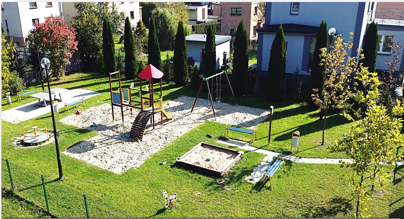
2014 i 2017 – budowa placów zabaw przy ulicy Rubinowej oraz przy ulicy Łukowej