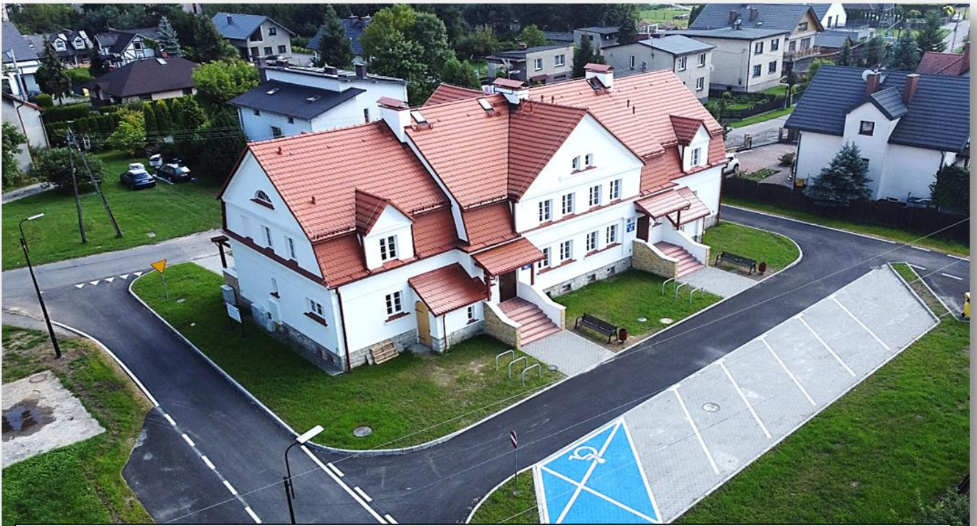
2021 – przebudowa budynku przy Orlej 4 na cele mieszkań socjalnych i chronionych wraz z parkingami i otoczeniem