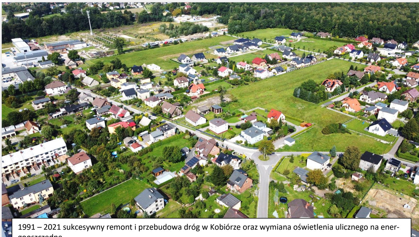
1991 – 2021 sukcesywny remont i przebudowa dróg w Kobiórze oraz wymiana oświetlenia ulicznego na energooszczędne