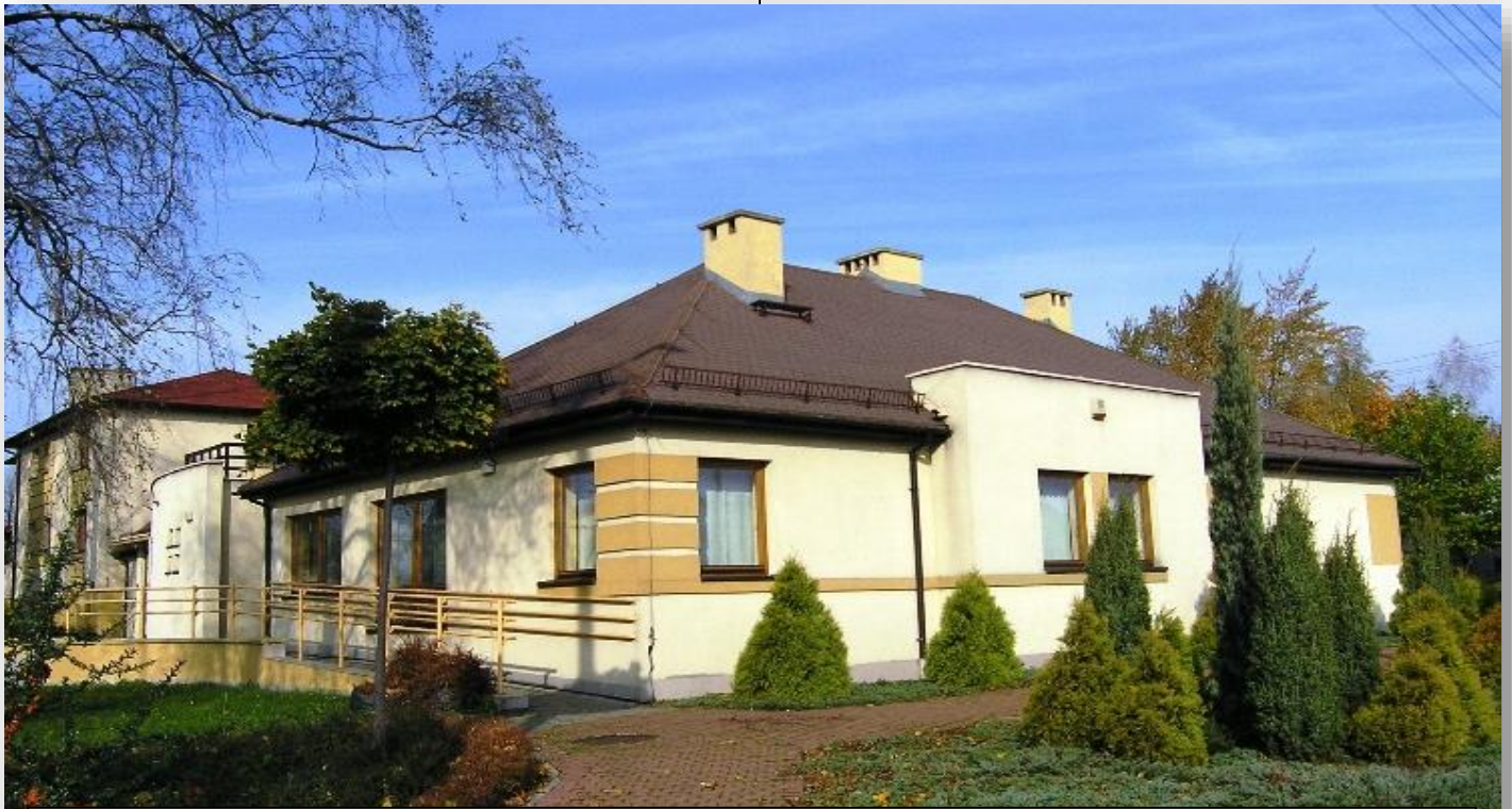
2001 – rozbudowa budynku ośrodka zdrowia przy ulicy Centralnej