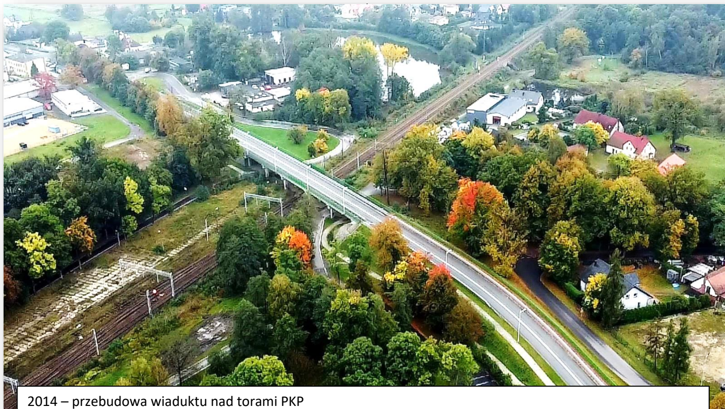
2014 – przebudowa wiaduktu nad torami PKP