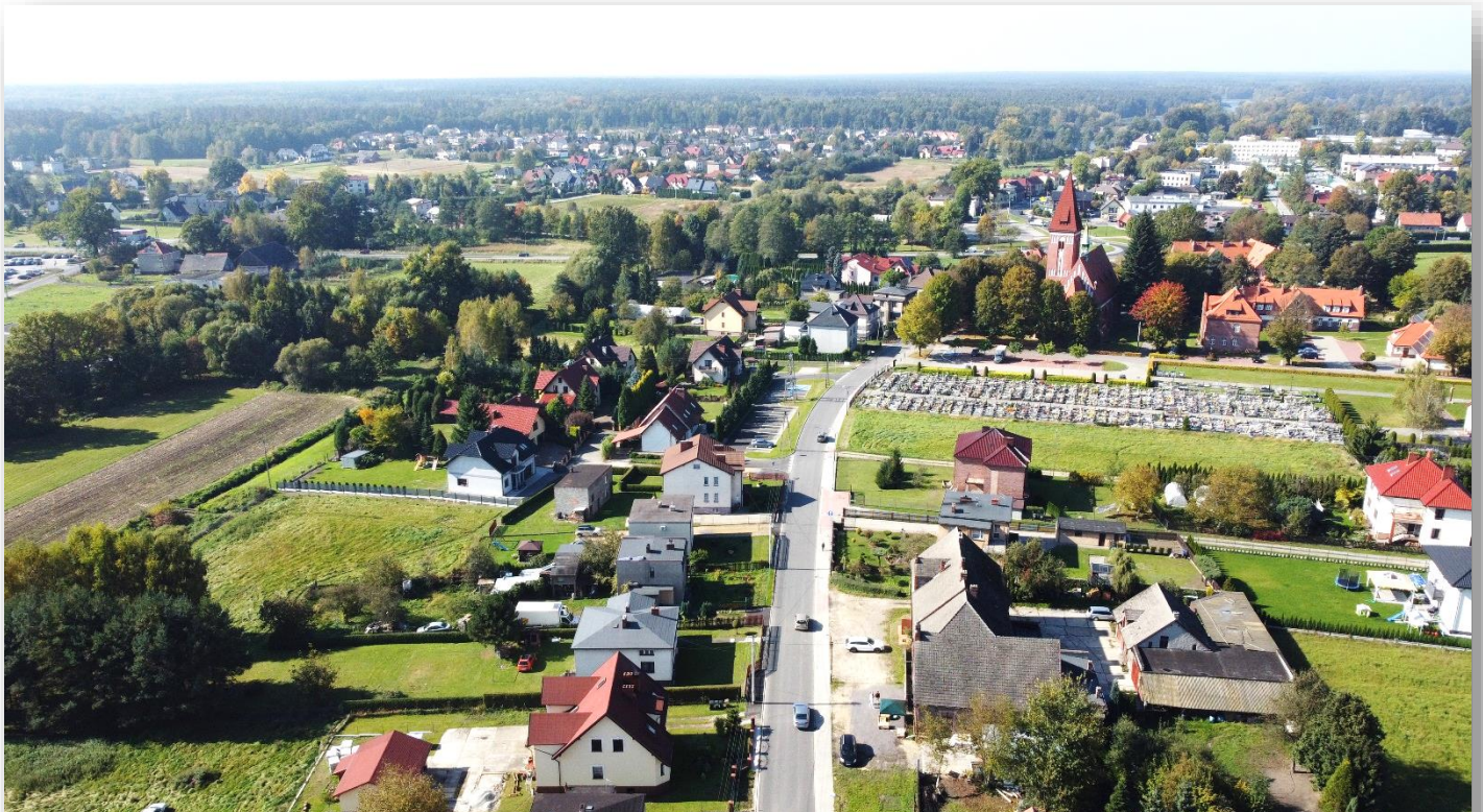
2021 – przebudowa ulicy Rodzinnej