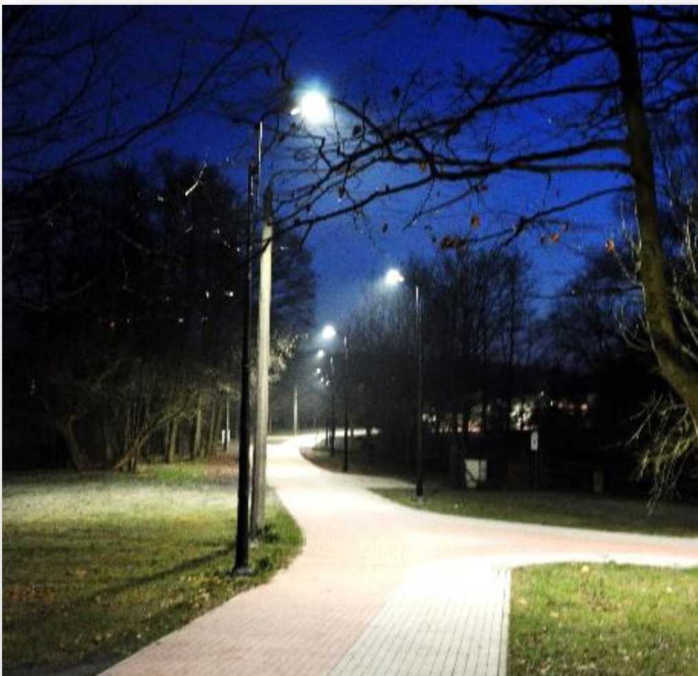
1991 – 2021 remont, przebudowa oraz budowa chodników i ścieżek rowerowych na terenie Kobióro