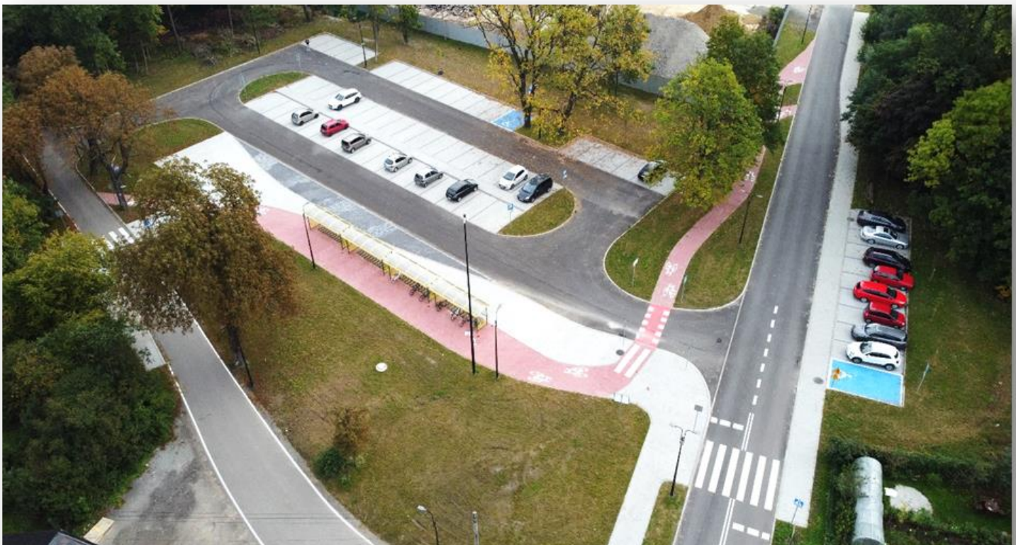
2021 – wykonanie parkingów park & ride przy dworcu PKP i dróg dojazdowych Żelaznej oraz Plichtowickiej