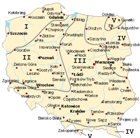
Rysunek 4.2.-1 Podział Polski na strefy klimatyczne.