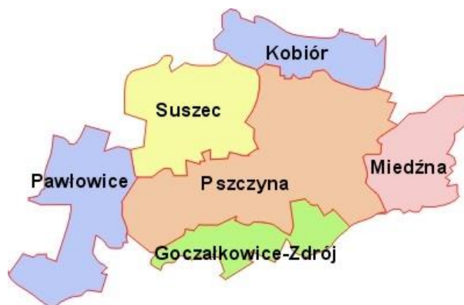
Rysunek 4.1.-1 Lokalizacja Gminy Kobiór w powiecie pszczyńskim

Gmina sąsiaduje z następującymi miejscowościami: